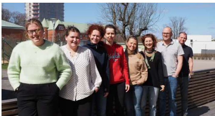
Del av styrelsen